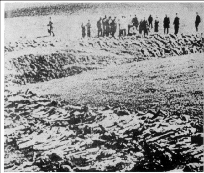
Bodies of the dead at Babi Yar ravine outside of Kiev on September 29-30, 1941. Sonderkommando 4a of Einsatzgruppe C executed 33,771 Jews here, and the area was used by the Nazis for mass executions until the Red Army captured it. Soviet authorities estimate some 100,000 persons were executed at Babi Yar ravine.

Üble Greuelmalerei, die als „historisches Fotodokument“ ausgegeben wird. Die übergangslosen schwarz-weiß Partien widersprechen zudem normalen Schattenverhältnissen. Auch „die Leichen“ bestehen nur aus weißen Farbklecksen auf dunklem Grund bzw. schwarzen Farbklecksen auf hellem Grund. Eine Schlucht, in die „die Opfer“ hinabgestürzt worden seien, ist nicht erkennbar.