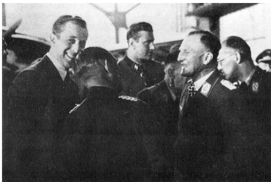
In Peenemünde 1944. Links Hans Fritzsche, Bildmitte mit Blick nach rechts SS-Sturmbannführer Otto Skorzeny.